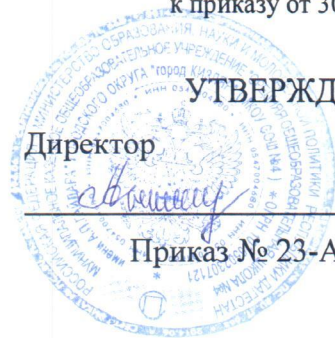
ГРАФИК питания обучающихся 1-4 классов МКОУ СОШ № 4 ГО «город Кизляр»